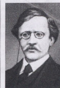
Ерік Нільс Адольф Норденшельд