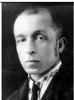
С. Л. Рудницький (1877-1937)