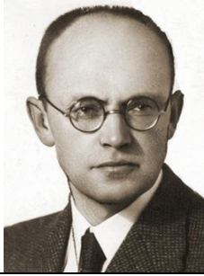
В. Кубійович (1900–1985)