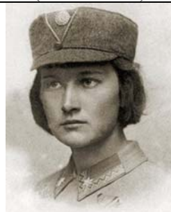
О. Степанів (1892-1963)