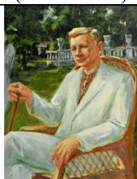
В. Тимошенко (1885-1965)