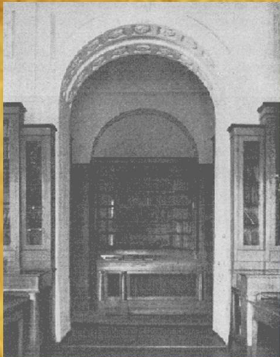
Фрагмент читальної зали бібліотеки Кременецького ліцею.

Бібліотека гімназії (ліцею) займала частину правого крила будинку, де раніше знаходився єзуїтський колегіум. Зала була поділена на дві частини: колонну, в котрій відбувалися лекції, концерти, дискусії, та бібліотечну, де знаходився читальний зал. Користуватися бібліотекою могли всі бажаючі.