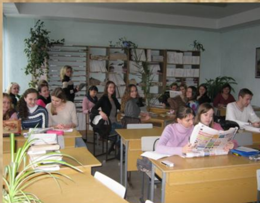
Читальний зал періодичних видань

У 1989 р. до послуг читачів було відкрито читальний зал періодичних видань, що сприяло покращенню умов для самостійної роботи читачів.