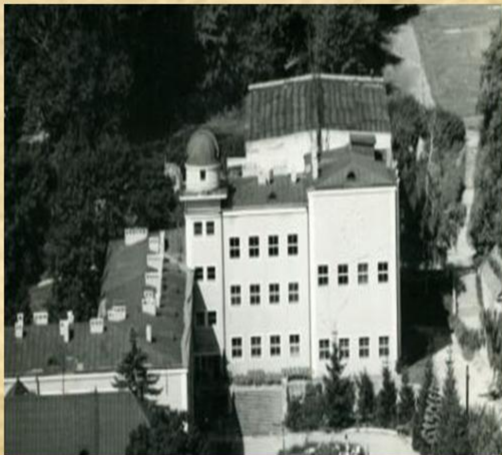
Кременецький державний учительський інститут, 1940 р.

З метою розв'язання проблеми підготовки педагогічних кадрів для середніх шкіл західних областей України, постановою Ради Народних Комісарів УРСР від 15 квітня 1940 року на базі ліцею було відкрито учительський інститут.