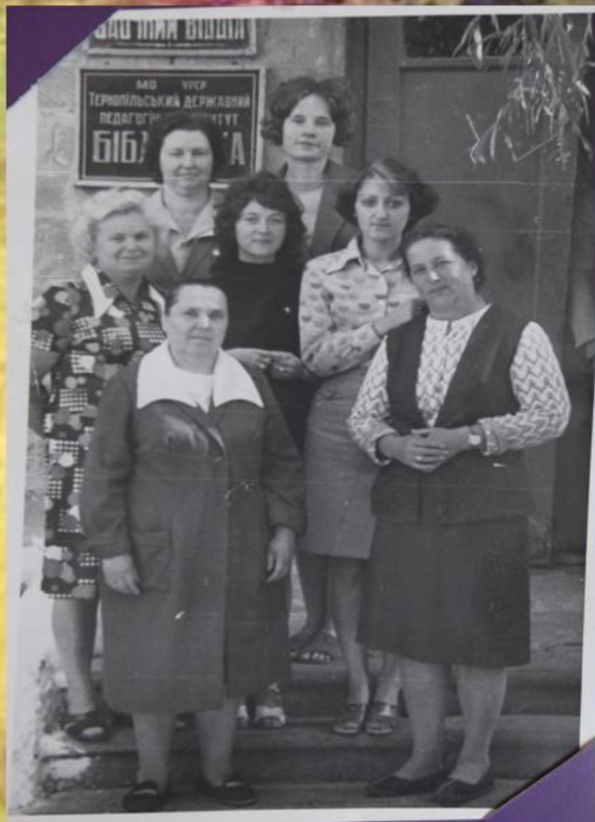
Колектив бібліотеки Тернопільського державного педагогічного інституту (6 листопада 1977 р.)

У 1969 р. Кременецький педагогічний інститут переводять у м. Тернопіль. Почався новий етап у розвитку бібліотеки Тернопільського державного педагогічного інституту. Розмістилась вона у пристосованому приміщенні.