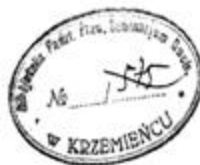
Печатка бібліотеки державної православної духовної семінарії в Кремені