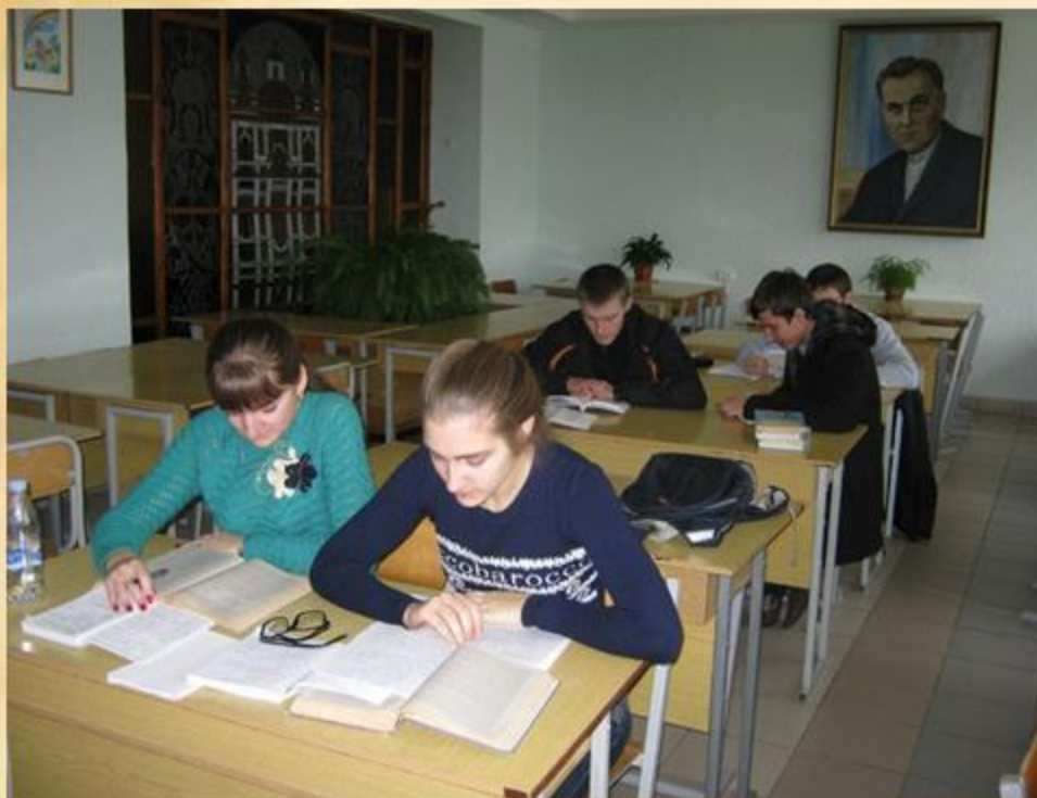
Читальний зал психолого-педагогічної літератури

У 1990 році відкрито читальний зал психолого-педагогічної літератури. Укомплектування фонду залу проходило за рахунок підняття із книгосховища всіх навчальних посібників, починаючи з 1985 року. Також співробітники бібліотеки налагодили тісні зв'язки з кафедрами психолого-педагогічного факультету.