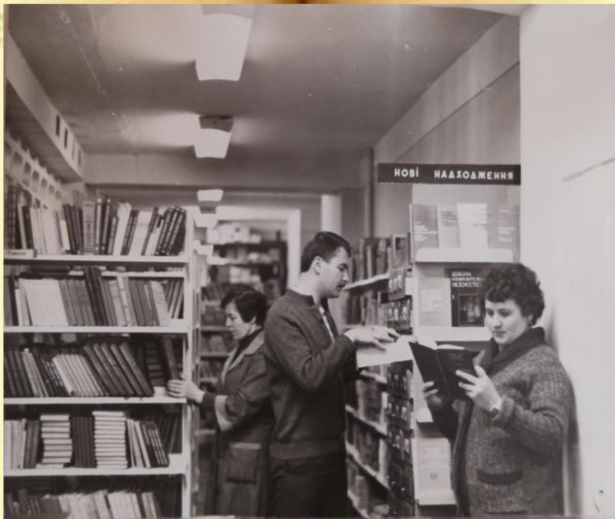
Працівники абонементу навчальної та наукової літератури