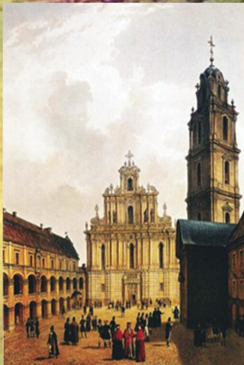
Кременецький ліцей 1805 р.