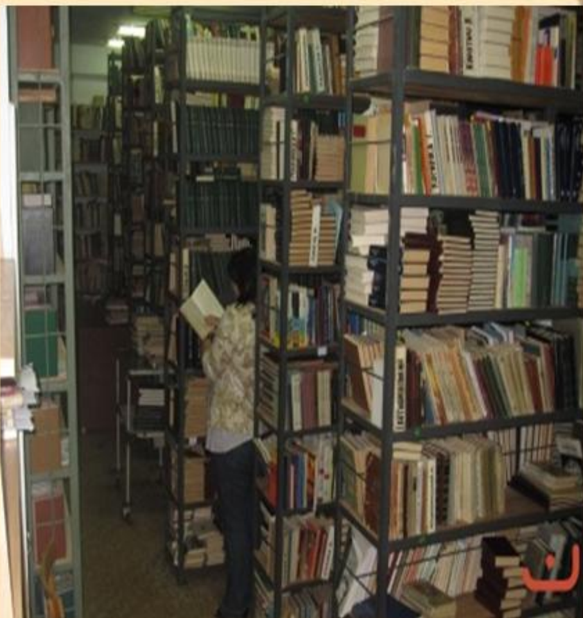
Абонемент художньої літератури

За весь час існування нашої бібліотеки тисячі студентів змогли отримати улюблені книжки на будь-який смак: твори українських, російських та зарубіжних письменників, поетичні збірки, історичні твори, мемуари, книги з фантастики, детективи, романи про кохання.