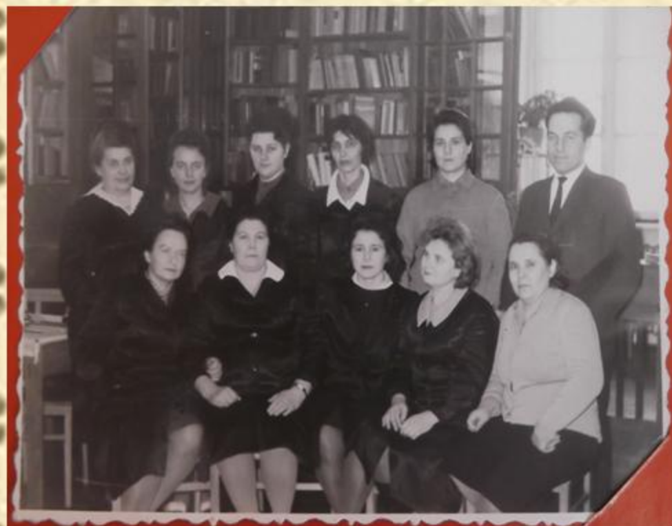
Колектив бібліотеки Кременецького учительського інституту (січень 1968 р.)