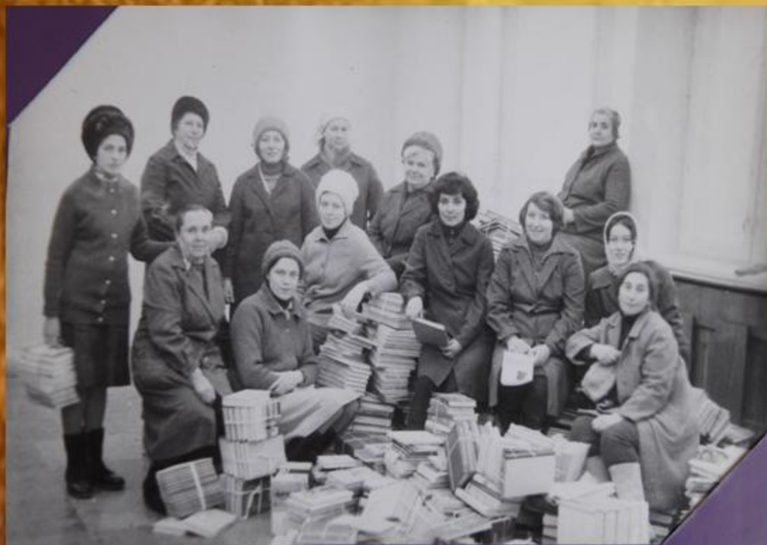
Переїзд бібліотеки у новозбудований головний корпус інституту (1978 р.)

Постійно у полі зору ректорату інституту стояло питання покращення умов для навчання студентів та забезпечення їх необхідними книгами. Так у 1978 р. книгозбірня перевозить свої фонди у новозбудований головний корпус інституту.