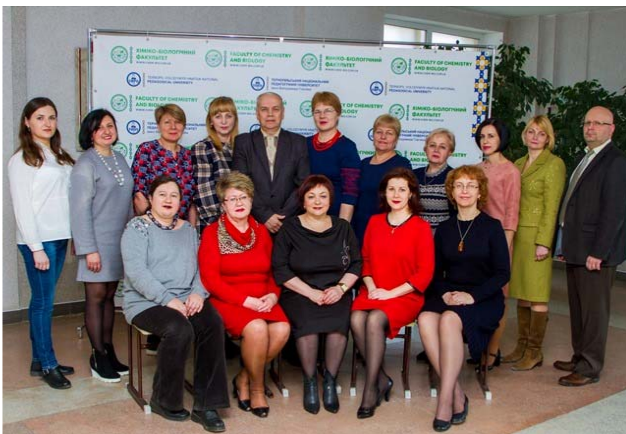
Кафедра загальної біології та методики навчання природничих дисциплін